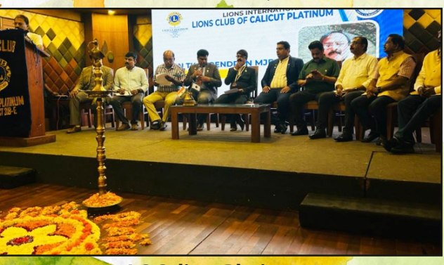
LC Calicut Platinum