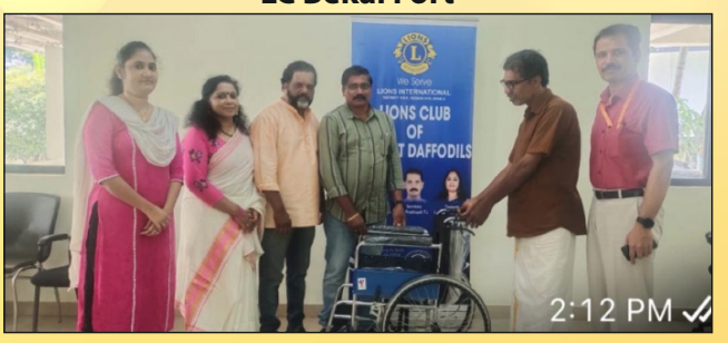
Donation of Wheel Chair to Kidney Patient LC Calicut Daffodils