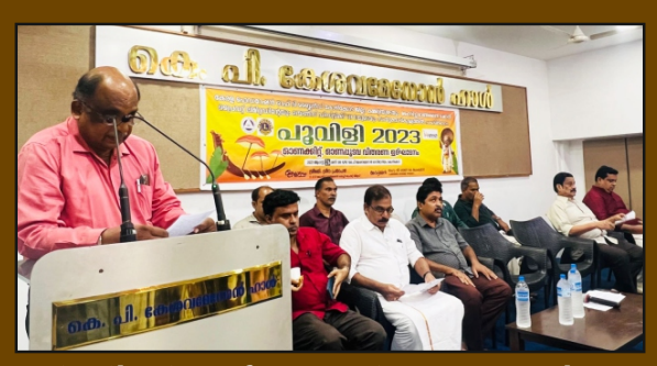
Distribution of Onam Kits & Ona Pudava by Calicut District Team