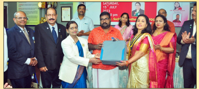
Donation of PAP Machine costing Rs. 26,000 LC Cannanore South