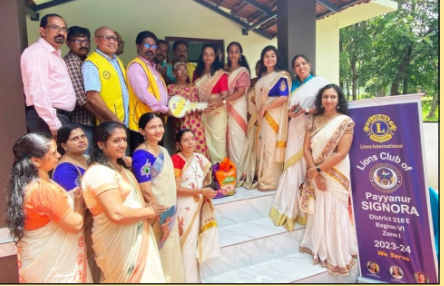
Home for Homeless Project LC Payyanur Signora