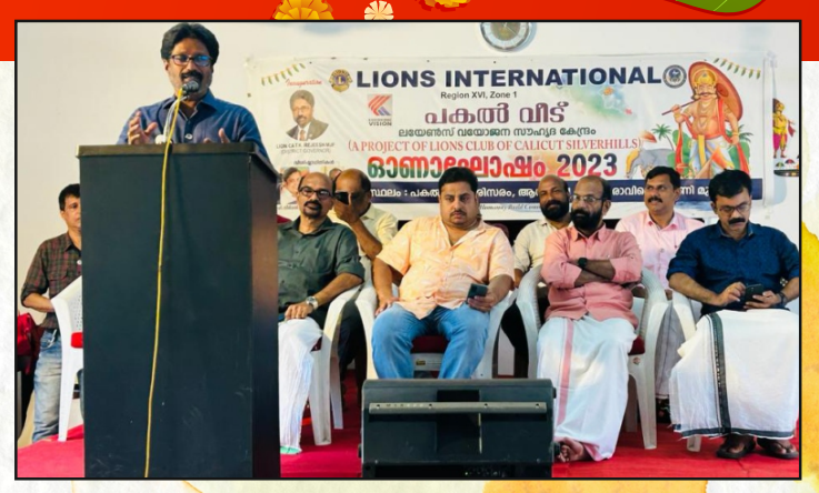
LC Calicut Silver Hills