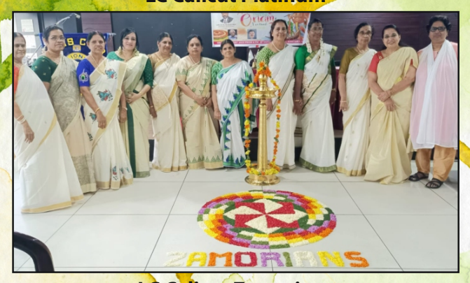
LC Calicut Zamorians