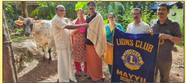
Honouring of Farmers LC Mayyil