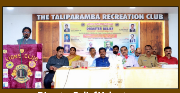
Disaster Relief Volunteers Free Training Camp