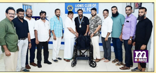
Donation of Wheel Chair LC Bekal Fort