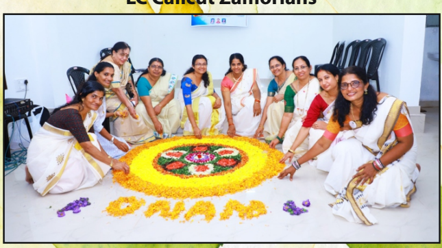
LC Kanhangad Town