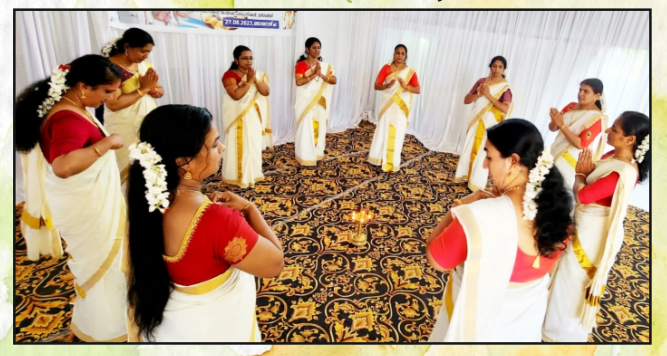
LC Kasargode Vidyanagar